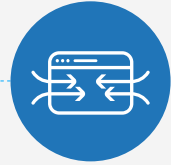
Rapportages, visualisaties en integratie